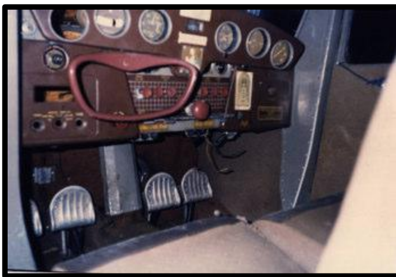
Figura 6 – Painel do Cessna “Brasil” avião utilizado no reide das três américas.

O avião que Ada Rogato realizou seu último voo, era um pequeno monoplane marca Cessna de asa alta, equipamento com motor continental de 90 HP com hélice metálica de passo fixo. Internamente esse Cessna possuía acomodações para duas pessoas, seu painel de instrumentos era o mais elementar para o voo, e, mesmo assim, apesar de ter aparelhamentos paupérrimos, Ada Rogato efetuou um voo de mais de 50.000 quilômetros pelas três Américas regressando sã e salva e coberta de glórias.